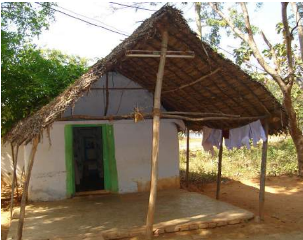
L'habitation des frères dans le village.