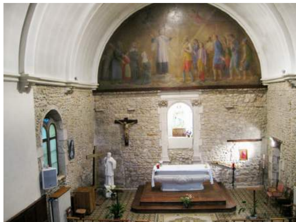
La chapelle de Montbernage dans son état actuel

Ainsi cette lettre aux habitants de Montbernage nous enseigne, entre autre, combien le père de Montfort sait toucher les cœurs des gens simples. La grâce du baptême ravivée au cours de la mission avec, au terme, le renouvellement public des vœux et promesses du baptême fait de chacune et chacun un missionnaire de la Bonne Nouvelle de Jésus-Christ. Il ne leur demande pas de fuir le quartier mais d'être comme le levain dans la pâte. Il leur rappelle les moyens simples pour tenir ensemble en particulier la prière du rosaire. Il peut partir le cœur libre, à la Providence, vers Rome. Il fait confiance en la grâce agissante de Dieu chez les pauvres et les humbles de cœur.