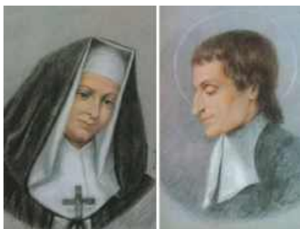
Sr Marie-Louise Trichet et le Père de Montfort

propres au statut de l'Enseignement Catholique, nous héritons, par nos fondateurs, d'une histoire et d'une tradition éducative uniques. C'est pourquoi, avec le conseil de tutelle, nous avons imaginé une présentation mettant en lumière ce qui constitue le fruit de nos spécificités, de nos inspirations et de nos réflexions : la différence et la richesse de nos établissements.