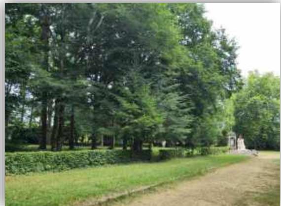
Calvaire de Pontchâteau, pôle rayonnant héritage vivant de Laudato Si'

Avec nos frères et sœurs les créatures, nous sommes appelés à louer Dieu, notre Père commun, en qui tout s'origine. Quand je prie seul le « Notre Père », j'aime parfois m'arrêter plus longuement sur le 'Notre' pour entrer en relation avec mes frères et sœurs humains d'aujourd'hui, mais aussi ceux d'hier et de demain, avec les esprits bienheureux : anges et saints, ainsi qu'avec toutes les créatures, de l'infiniment petit à l'infiniment grand, m'émerveillant de tout ce qui m'entoure.