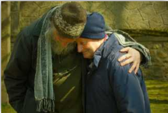
Accueil et écoute au Village St Joseph

Tous ces sujets sont peu abordés dans les programmes des partis politiques, hormis celui des migrants, pour proposer de leur fermer nos portes. Nous sommes pourtant là au cœur de l'écologie intégrale du pape François. Et pour lui : « Parmi les pauvres les plus abandonnés et maltraités, se trouve notre terre opprimée et dévastée. » (LS n°2)