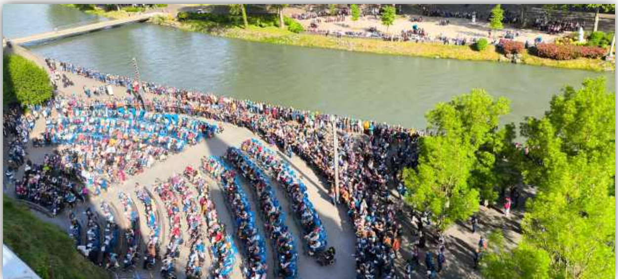
Durant le pèlerinage, célébration de la Messe à la Grotte de Massabielle.