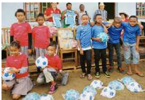
Remise des cadeaux