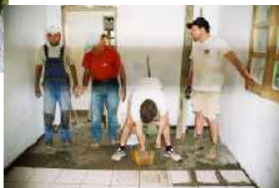
Pose des carrelages