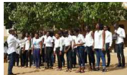
La chorale de Katakodi.