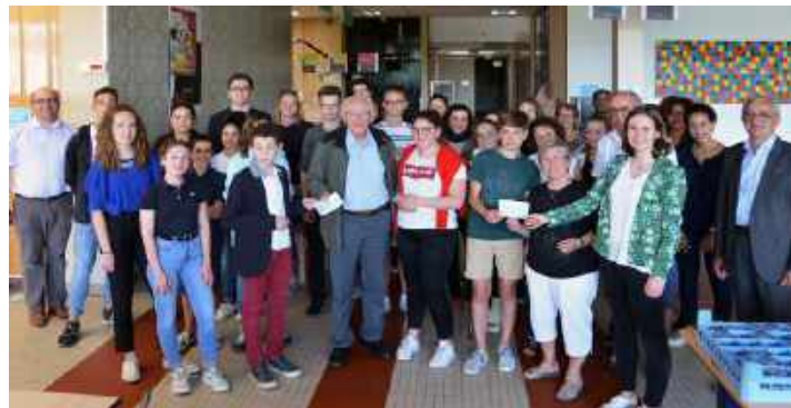
Remise de chèques pour SGS après l'opération bol de riz.

Les Frères de Saint-Gabriel forment un institut international. Des liens se tissent et des échanges se développent entre les jeunes de leurs établissements. En France, il est proposé que les enfants et jeunes soient sensibilisés à l'ouverture aux autres et aux moins favorisés. Porter un regard valorisant sur chacun, ouvrir au sens de la différence, au partage, à l'universel, tels sont quelques-uns des repères que l'on trouve dans le projet éducatif gabriéliste. Chaque année des actions de solidarité sont proposées comme les « opérations bol de riz, les challenges humanitaires » destinés à soutenir les projets que l'association SGS accompagne. Depuis quelques années, des élèves des collèges et lycées participent à des voyages et se rendent dans des pays étrangers, proches (Espagne, Pologne, Italie, Angleterre) ou lointains (Sénégal, Inde). Des élèves de pays étrangers sont accueillis à leur tour en France. Les participants en reviennent enrichis de la connaissance de l'autre et