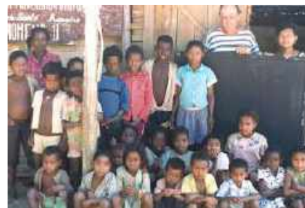
Dans une école de brousse.