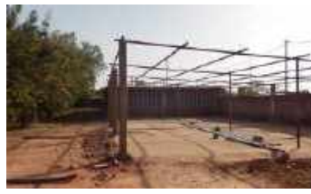
Le préau avant les travaux