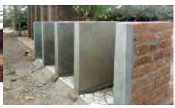
Sanitaires pour garçons