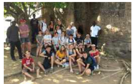
Élèves de Saint-Gabriel de Saint-Laurent au Sénégal - avril 2018.