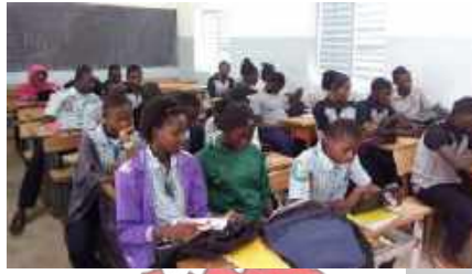
Utilisation des tablettes