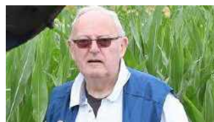
Au pèlerinage montfortain.