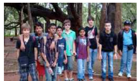
Élèves du collège Saint-Augustin d'Angers accueillis en Inde.